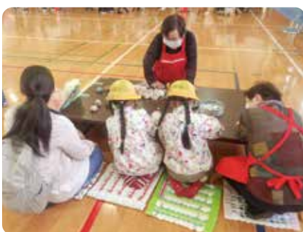
地域ごとの特性を活かした福祉活動を実践する支部社協事業