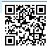
ボランティア体験申込