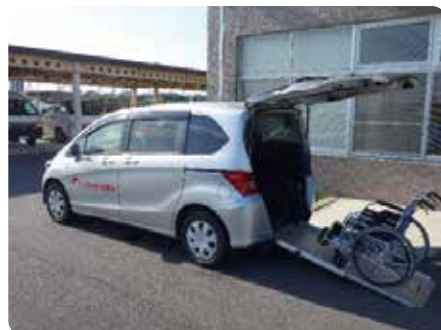
高齢者や障がい者などの外出支援