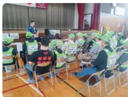
大規模災害時の災害ボランティアセンターの立ち上げなどに取り組む防災対策事業