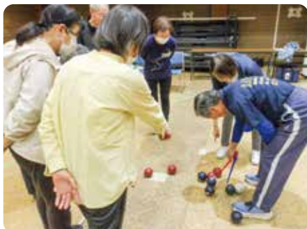
仲間や居場所づくりを目的とした登録サロンに対する活動支援