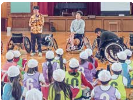
小、中学生を対象とした体験型の福祉教育