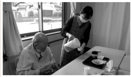
高齢者施設ボランティア