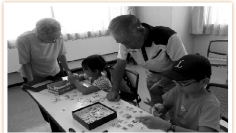
使用済み切手整理体験