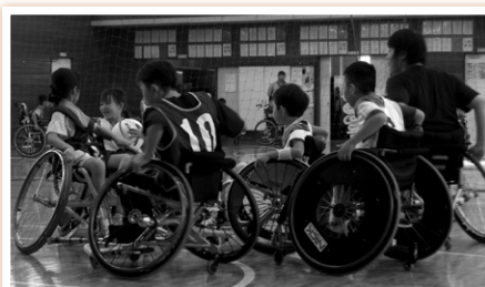
車いすバスケット体験

今後、ボランティアを継続することで、また新しい発見や出会いがあるかもしれません。ボランティア活動をしたいかたは、ぜひ社協までご連絡ください♪