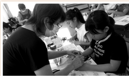
ぼんぼん人形作り体験