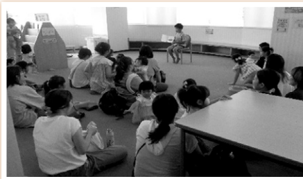
絵本の読み聞かせ体験