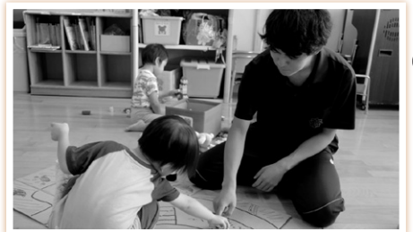
保育所ボランティア