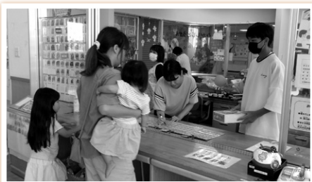
児童館のお手伝い