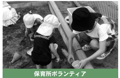
保育所ボランティア