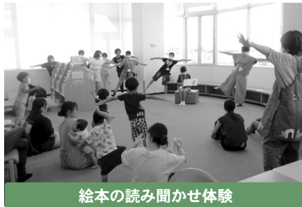
絵本の読み聞かせ体験