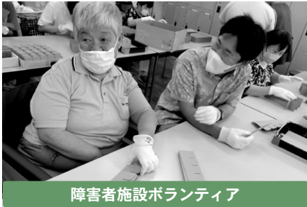
障害者施設ボランティア