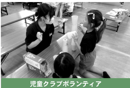
児童クラブボランティア