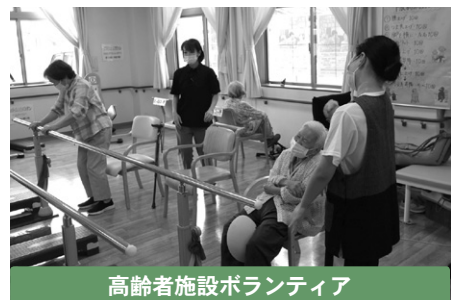
高齢者施設ボランティア