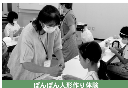
ぼんぼん人形作り体験

今後、他のところでボランティアをしてみることで、また新しい発見や出会いがあるかもしれません。ボランティア活動をしたいかたは、ぜひ社協までご連絡ください。