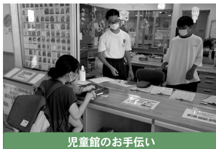
児童館のお手伝い