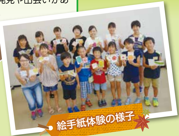
絵手紙体験の様子

ボランティアの受け入れをしてくださった施設や事業所、並びにボランティアグループの皆さんには、大変お世話になりました。深く感謝申し上げます。