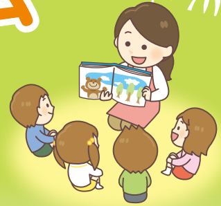
各体験先での活動の様子

今回のプログラムをとおして、ボランティアに少しでも興味を持ってもらえると嬉しいです。今回のプログラムだけでなく、他のところでボランティアをしてみることで、また新しい発見や出会いがあるかもしれません。ぜひ、活動してみてください。