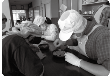
1度目のハンドピック中。丁寧に、メンバーさんが生豆の仕分けをしています。