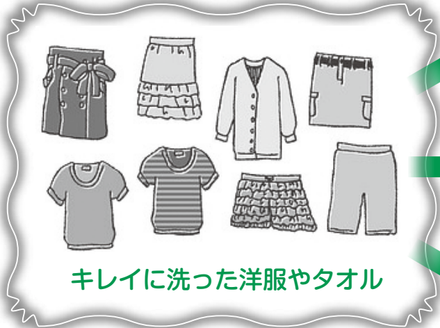
キレイに洗った洋服やタオル

着なくなったお洋服や着物はありますか？ ありの実館にお持ちください。古着を様々なものに活用しています♪