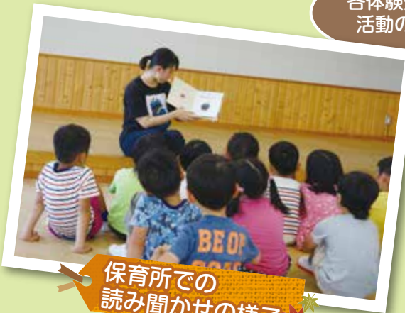
保育所での読み聞かせの様子