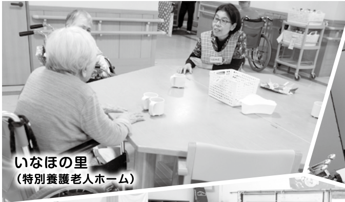
いなほの里 (特別養護老人ホーム)

今年度は小学生から大人のかたまで、延べ99名の参加がありました。ご協力いただいた施設、事業所およびボランティアグループの皆さん、そして参加して下さった皆さん、ありがとうございました。