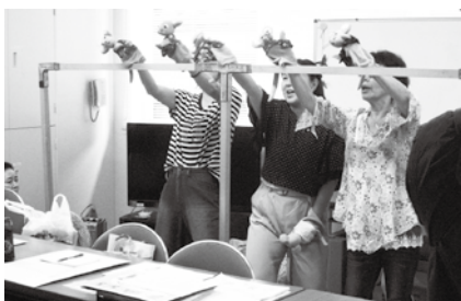
ボランティア活動（人形劇）