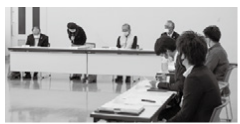
(第1回策定委員会10月26日開催)

現在、次期計画の策定に向け策定委員会を設置して協議を進めているところです。今後、パブリックコメントを令和3年2月に実施する予定ですので、皆様からのご意見、ご要望等をお聞かせください。