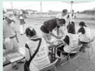
災害VC立ち上げ訓練の様子（受付班） （九都県市合同防災訓練 会場：白岡市）