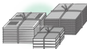
新聞・雑誌・段ボール