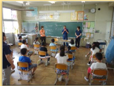
小中学生の福祉教育