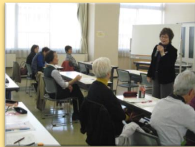
ボランティア活動支援