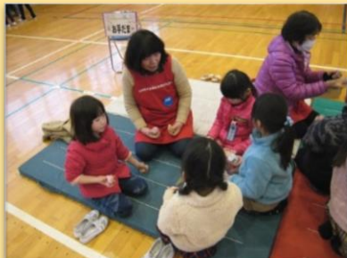
小学校区ごとの小地域福祉活動