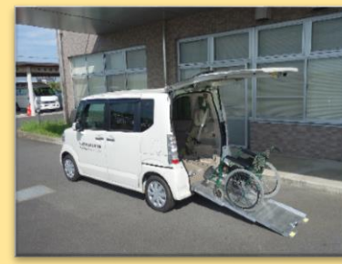
福祉車両、車いす貸出