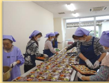
高齢者へのお弁当配達